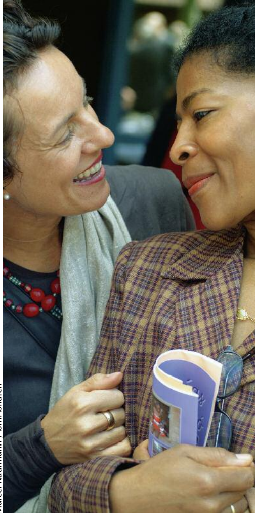
Marcel Kaufmann / bmi-bild.ch

Das ist ein sehr gewichtiger Vorwurf, weil es hier nicht um irgendwelche Nebenschauplätze, sondern um den Kern der christlichen Botschaft geht. Denken wir nur an das Hauptgebot. Es sagt uns, worum es im Glauben geht: um Gottesliebe, Nächstenliebe und Selbstliebe. Wenn eine dieser drei Dimensionen aufgegeben wird, leiden auch die andern fundamentalen Schaden. Dem Vatikan liegt offensichtlich die Gottesliebe besonders am Herzen, der Befreiungstheologie die